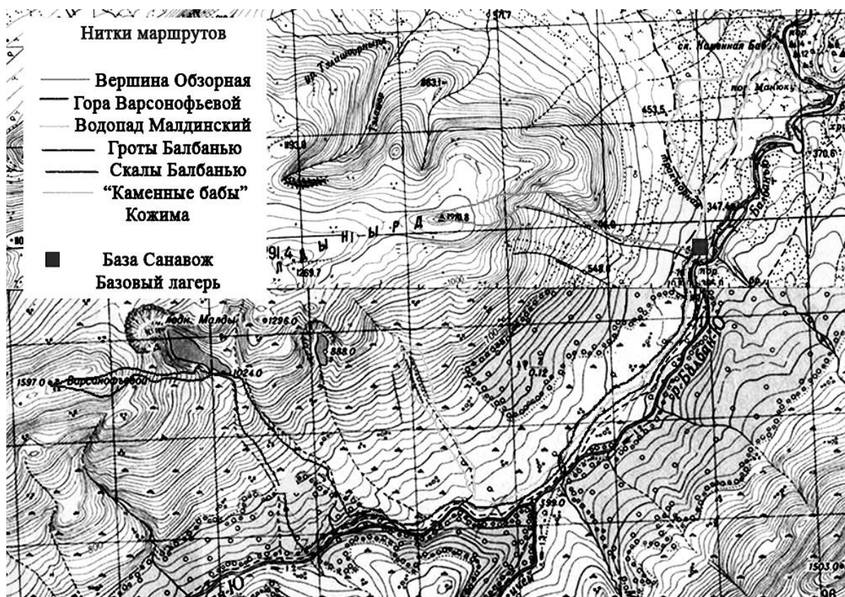
Figure 3. Сеть ландшафтных экотроп от базы Санавож.

Этот же принцип необходимо брать за основу при проектировании инфраструктуры в таком «проблемном» районе парка, как маршруты к горам Народной и Манараге. Ценность популяций в верховьях р.Балбанью, где проходят эти маршруты, подтверждается тем, что до создания парка здесь находился ботанический заказник. Здесь, вблизи водораздела, находятся местобитания многих редких видов растений, в т.ч. арктосибирских. В силу климатических условий популяции здесь немногочисленны, и важно в буквальном смысле каждое растение. В 2014 г. в заповедную зону парка включен участок в верховьях притока Балбанью – р.Сюразьрузьвож, где сохранились популяции многих краснокнижных видов.