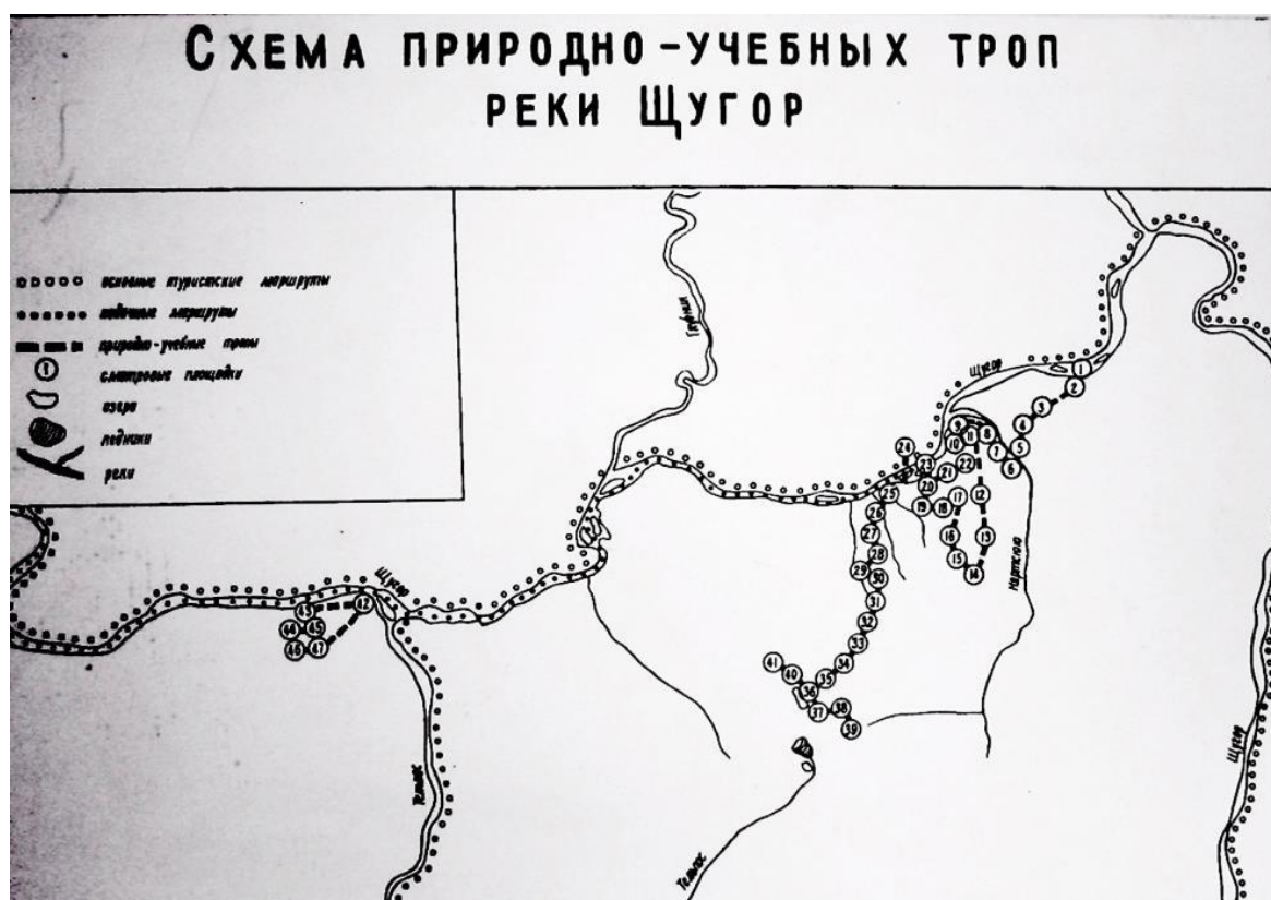
Figure 1.Схема природно-учебных троп в районе массива г. Тельпос-из.

Тартуского государственного университета в 1973-1974 гг. в южной части парка, в районе массива г.Тельпос-из [6]. Попастъ к началу этих троп можно было только сплавом по р.Щугор - одного из наиболее популярных тогда маршрутов этого района. На рис. 1 представлены схемы этих троп, представших собой одно- и многодневные маршруты. Например, точками 1-41 обозначен четырехдневный маршрут, проложенный от р.Щугор через низовья р.Няртсюю к подножию г.Тельпос-из.