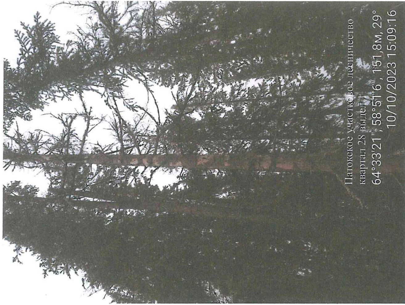
Папожское учасковое лесничество квартал 28 выдел 1 64°33'21", 58°51'6", 151,8м, 29° 10/10/2023 15:09:16