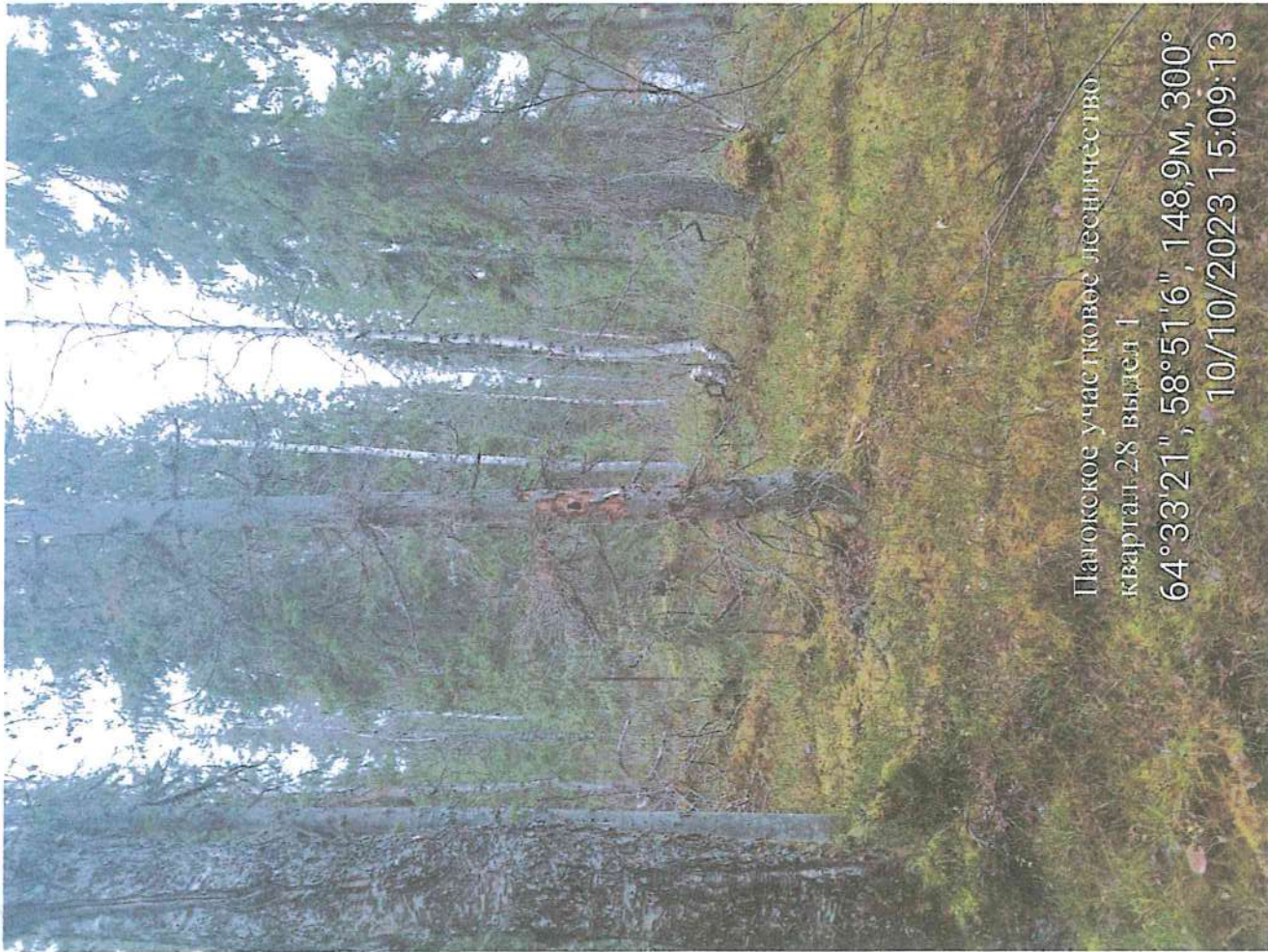
Папожское учас гвоное лесничество квартал 28 выдел 1 64°33'21", 58°51'6", 148,9м, 300° 10/10/2023 15:09:13