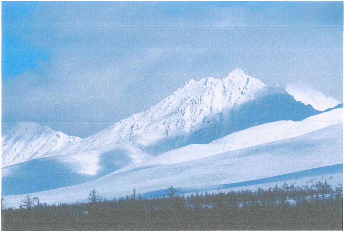
Фото 3. Гора Сабля.