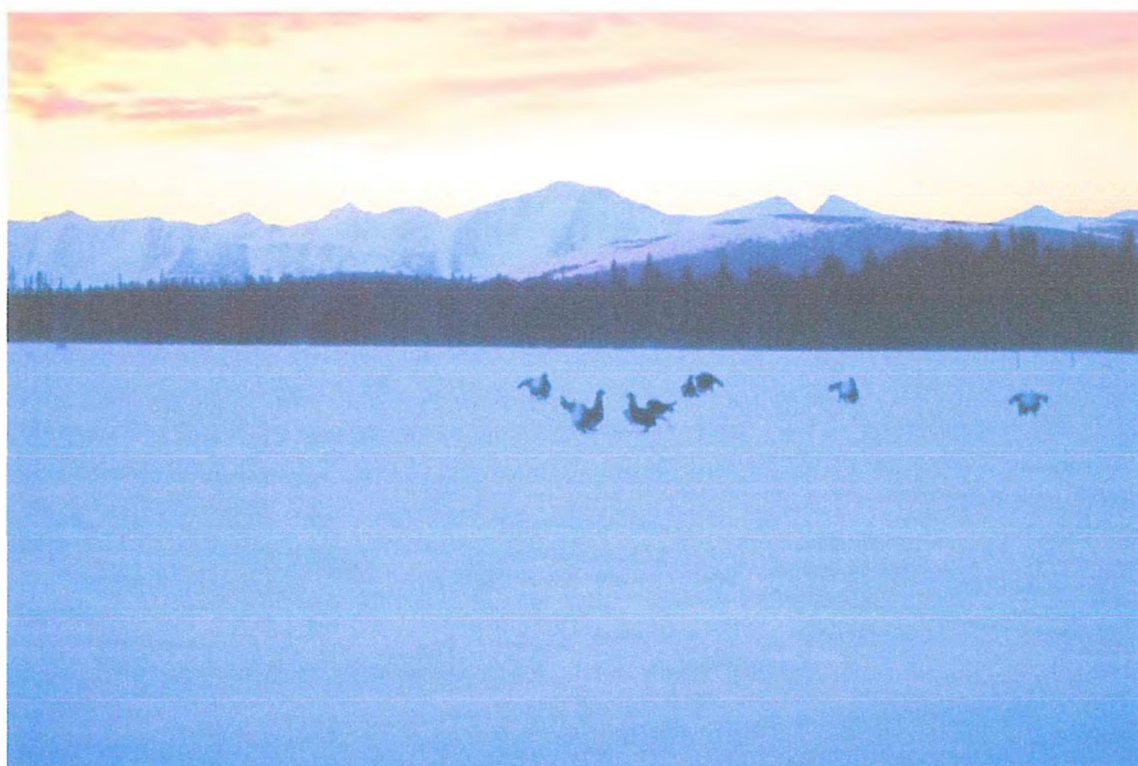
Фото 6. Токование тетеревов-косачей.