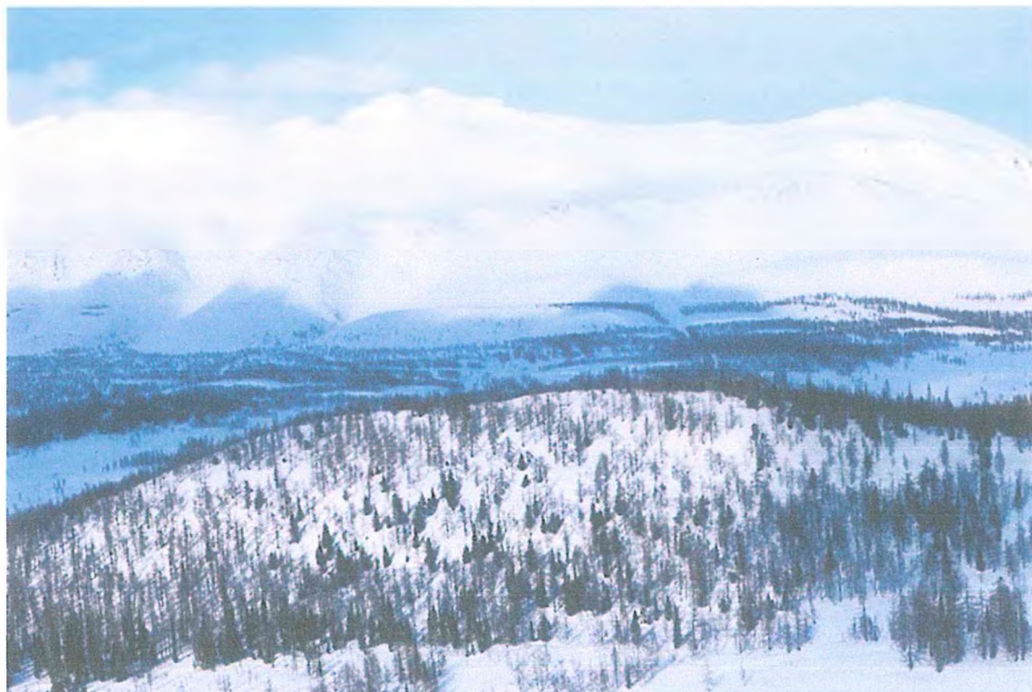
Фото 5. Мохнатая гора.