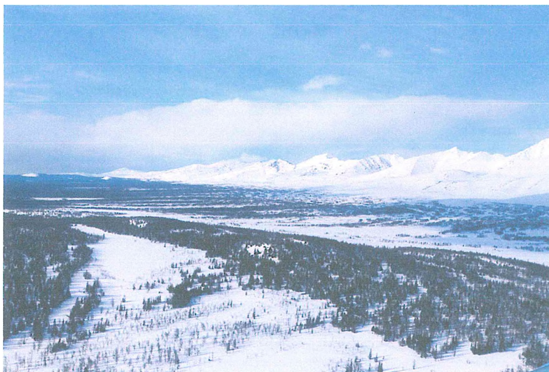
Фото 2. Саблинский хребет.