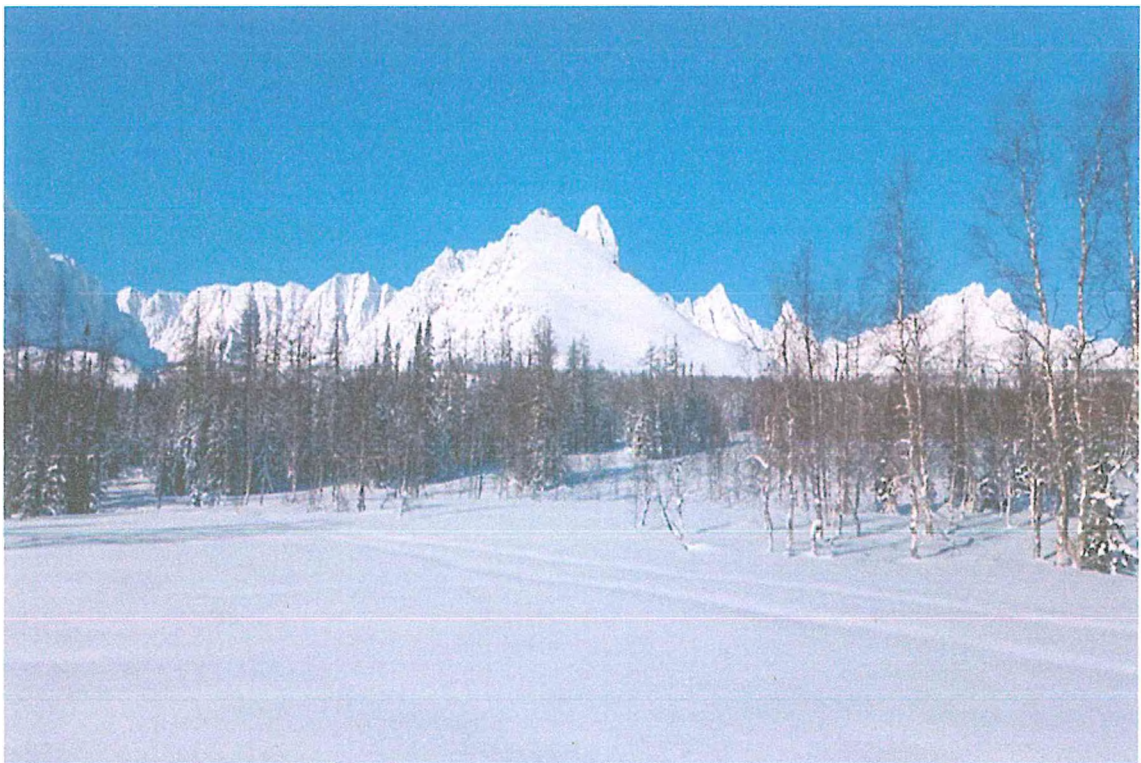
Фото 4. Сабля главная.