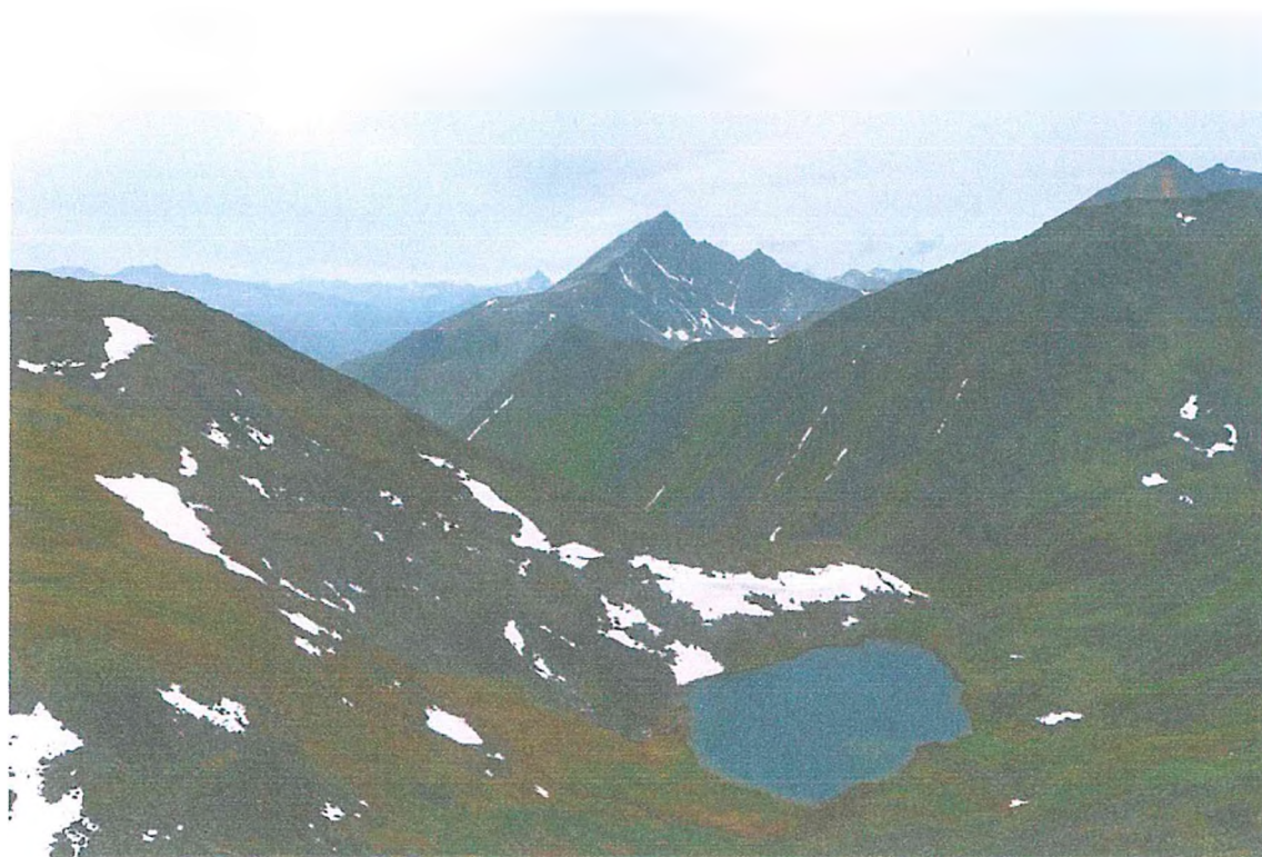
Фото 2. Перевал Зигзаг.