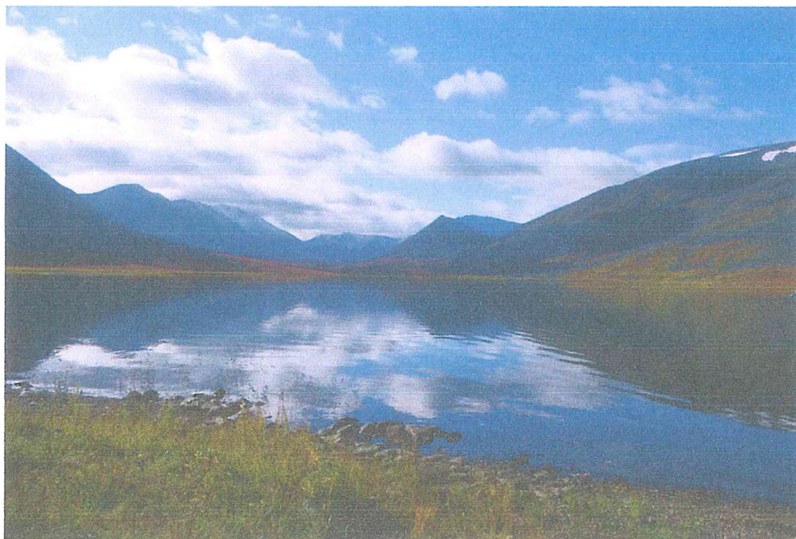
Фото 1. Озеро Малые Балбанты.