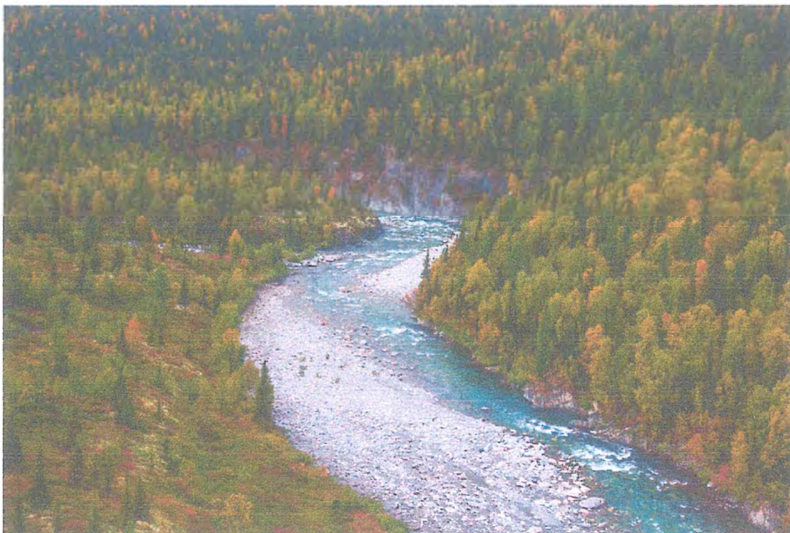
Фото 5. Река Косью.