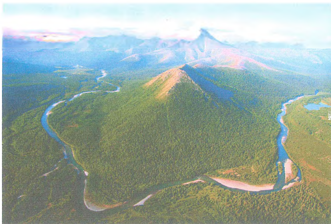
Фото 6. Река Косью.