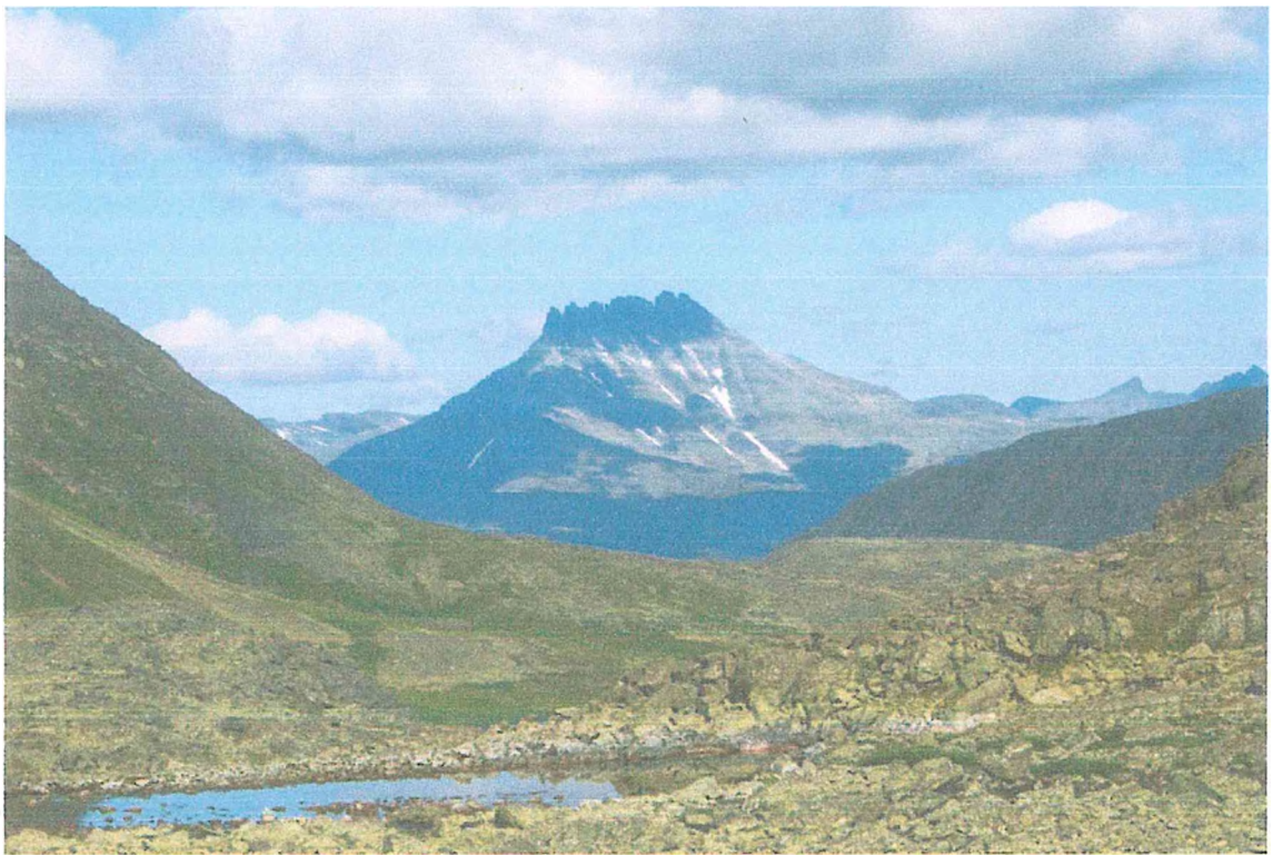
Фото 3. Гора Манарага.