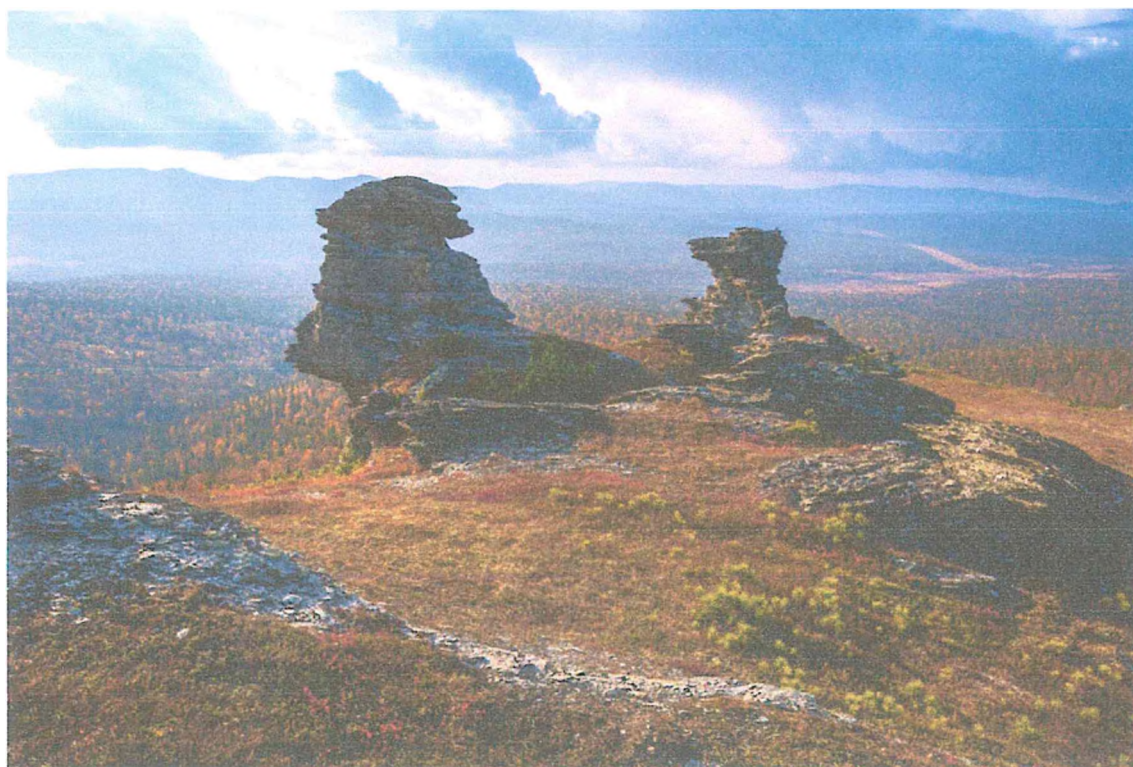
Фото 2. Останцы на горе Ярута.