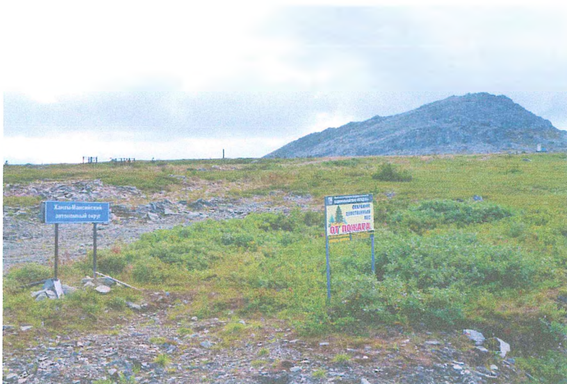
Фото 5. Знак границы Республики Коми и ХМАО.