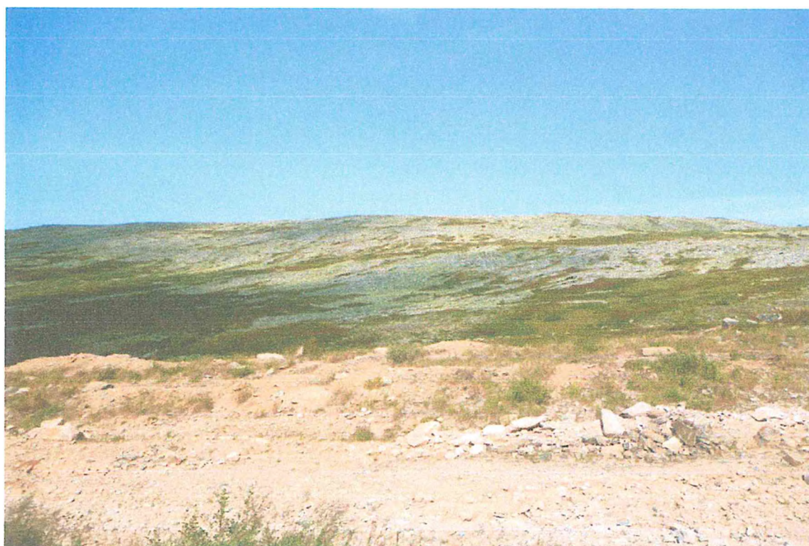
Фото 6. Гора Пеленёр.