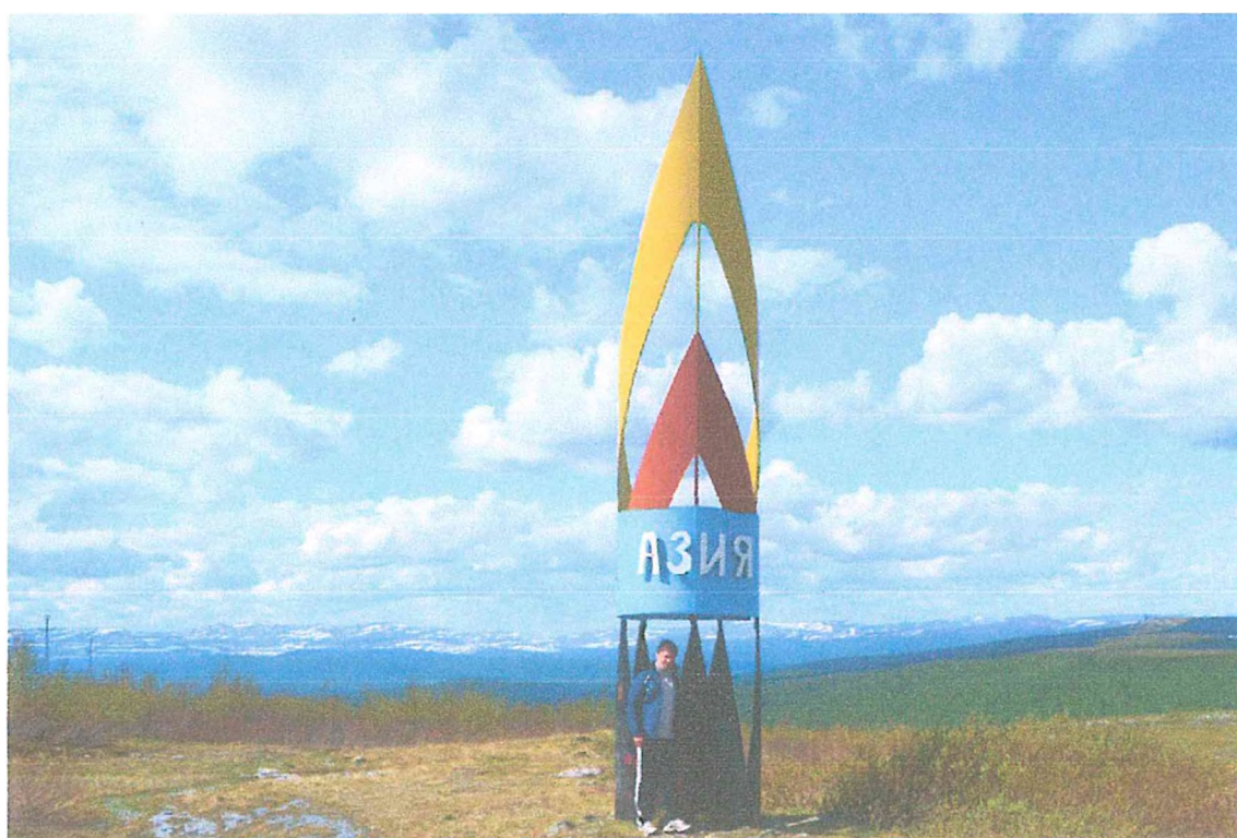
Фото 4. Стела Европа-Азия.