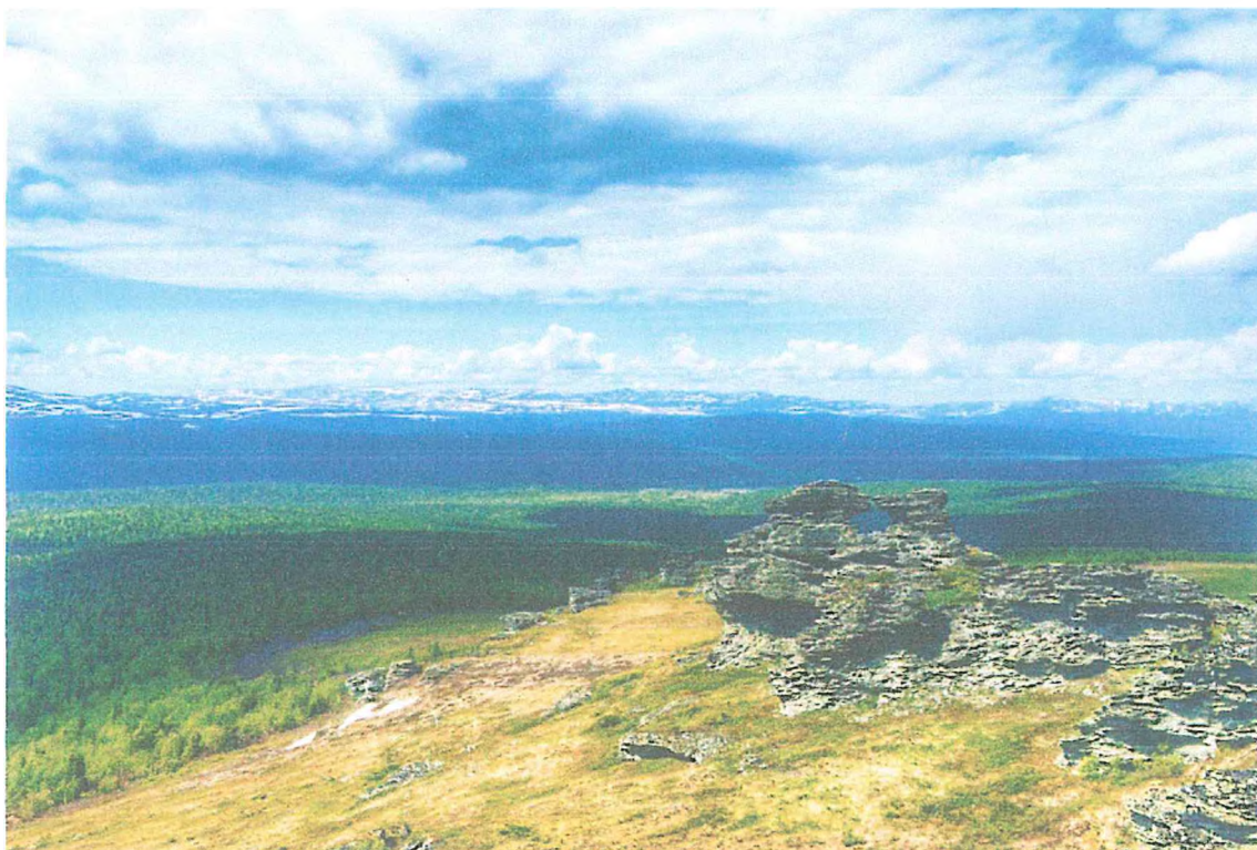
Фото 3. Панорама с горы Ярута.