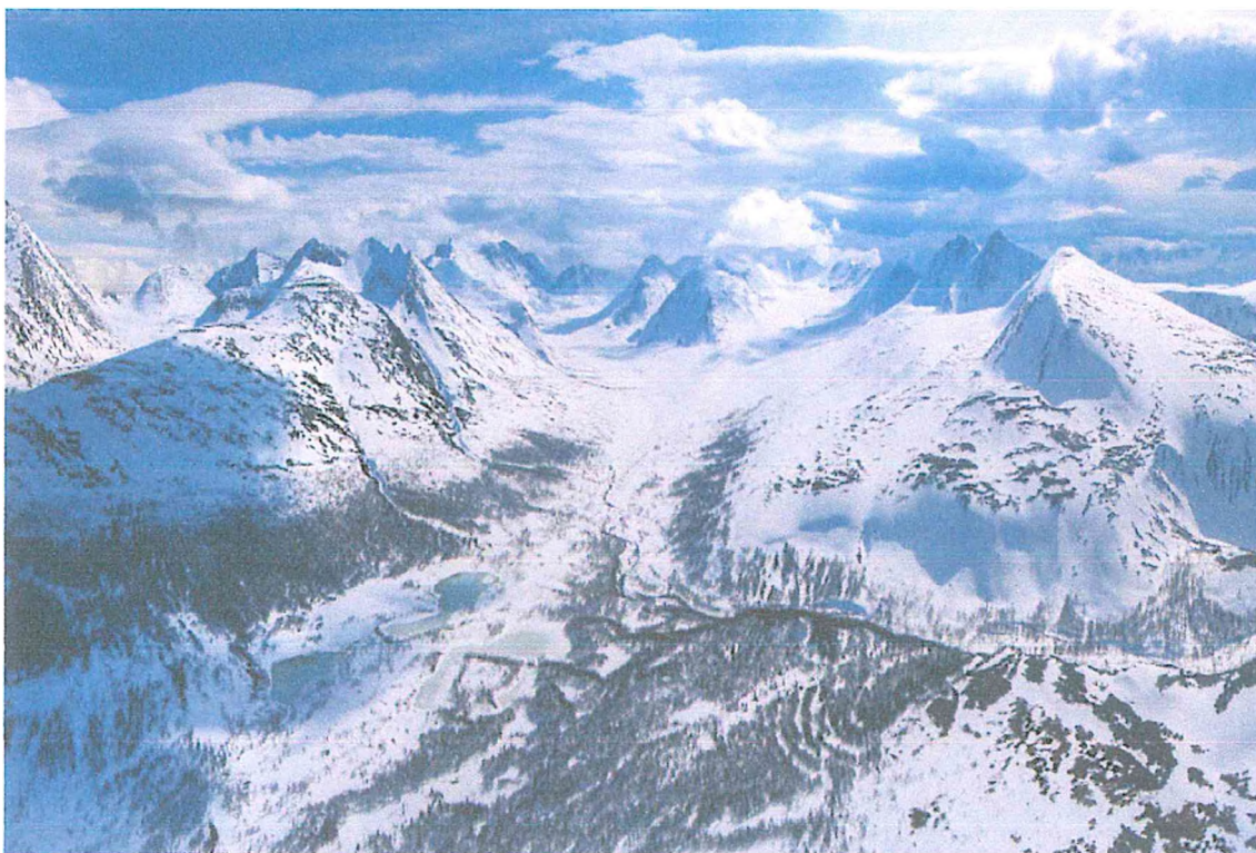
Фото 4. Долина реки Вангыр в среднем течении. Слева хребет Лапай, в центре гора Сундук, справа хребет Лоптай.