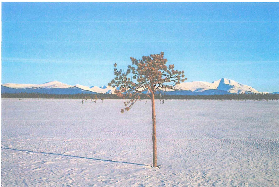
Фото 5. Сосна на фоне хребта Лапапай.