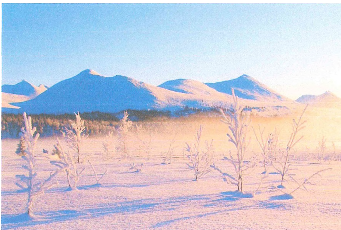
Фото 6. Район туристского приюта «Озёрная».