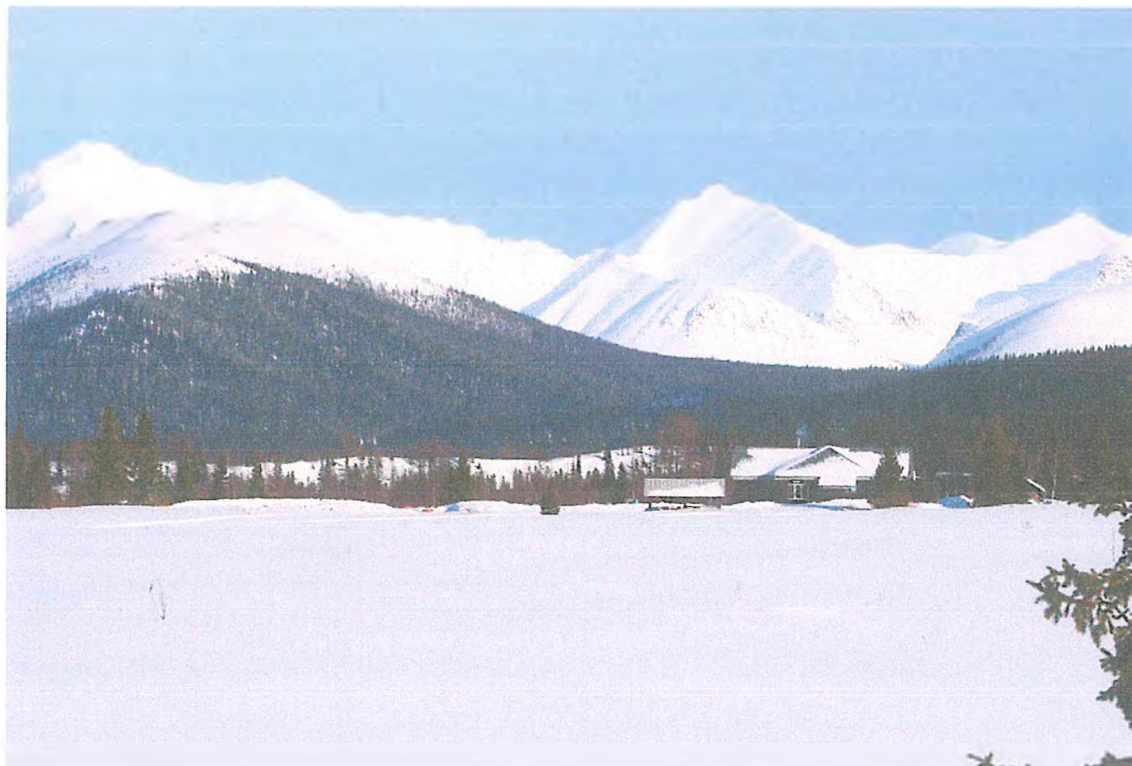
Фото 2. Туристский приют «Манарага». Хребет Непроступный.