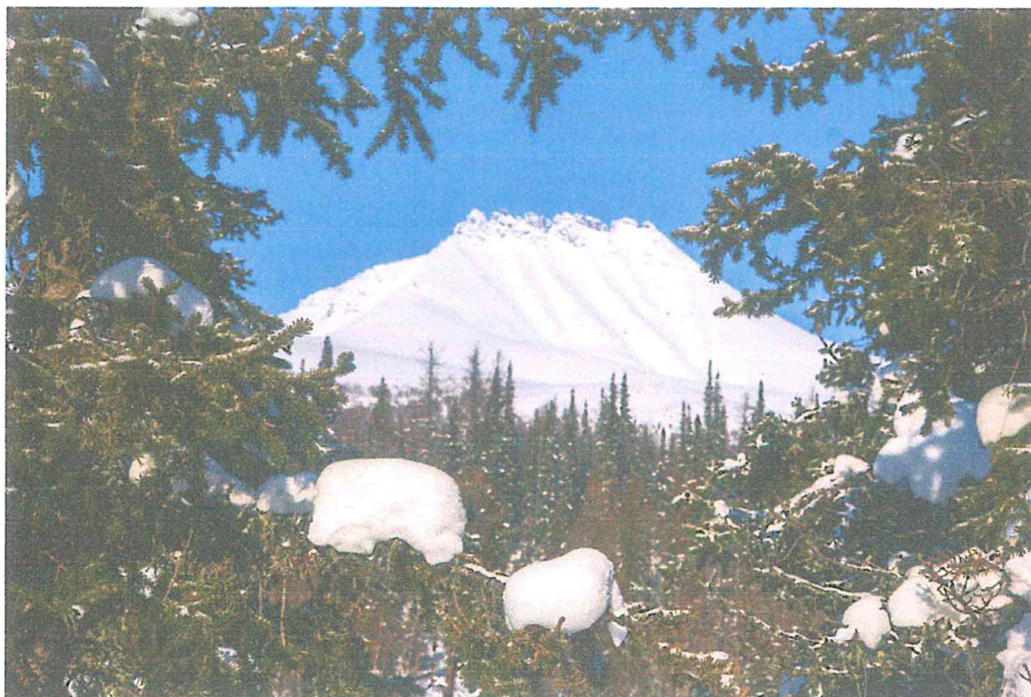
Фото 1. Гора Манарага.