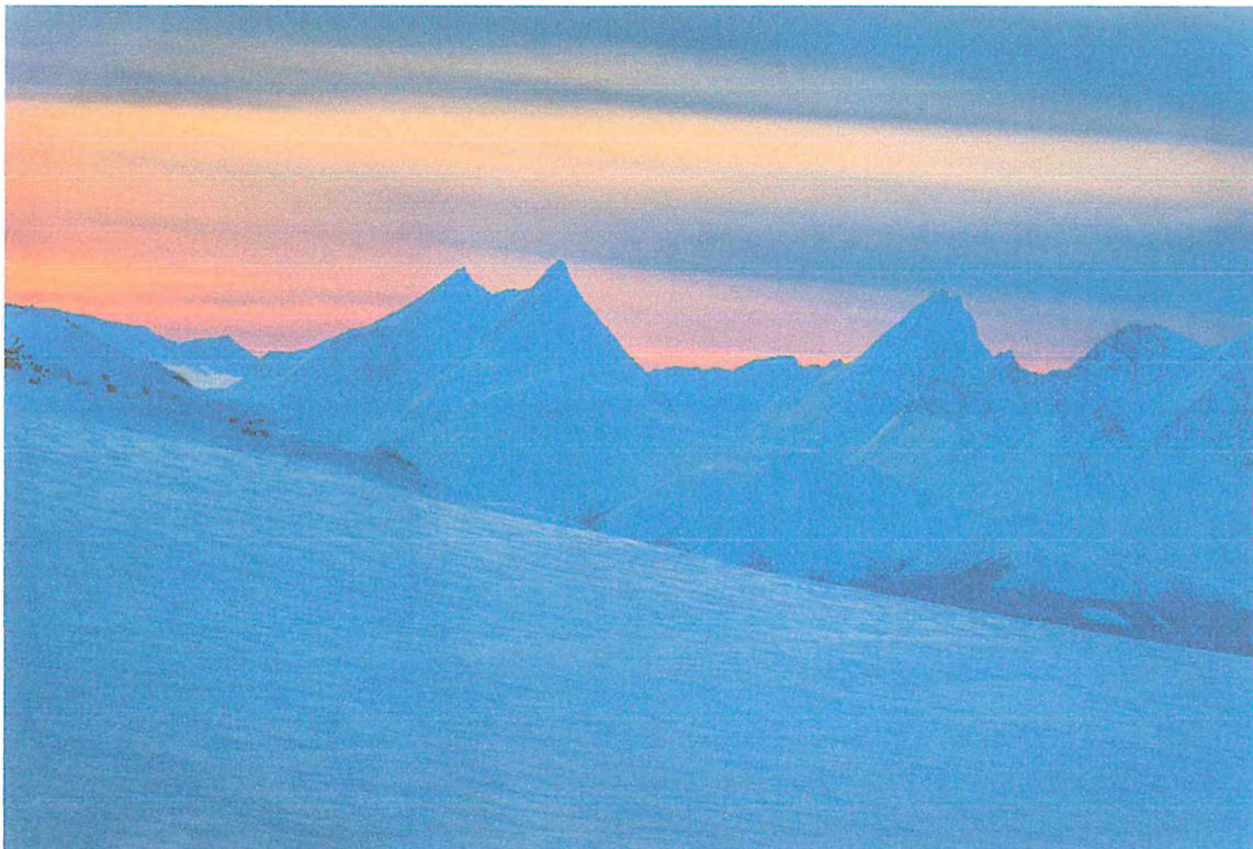
Фото 3. Массив Колоколен: пик Урал, Колокольня Масленникова, Колокольня Высоцкого.