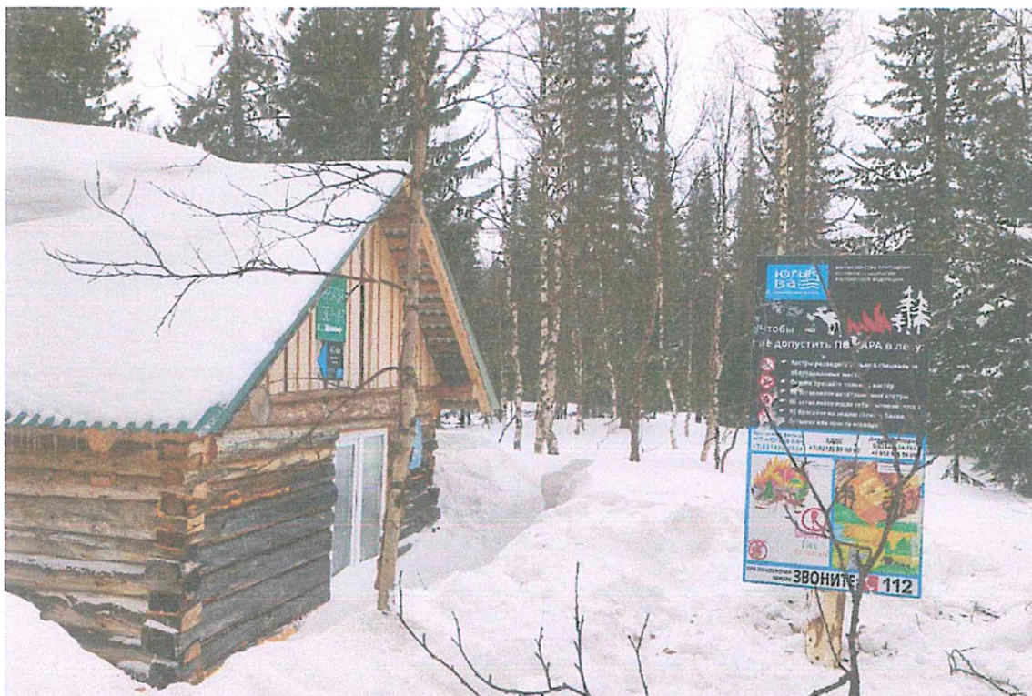
Фото 5. Туристский приют «Академия».