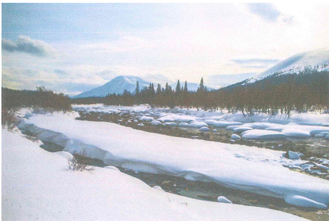
Фото 4. Река Войвож-Сыня. На заднем плане – г.Шудаиз.