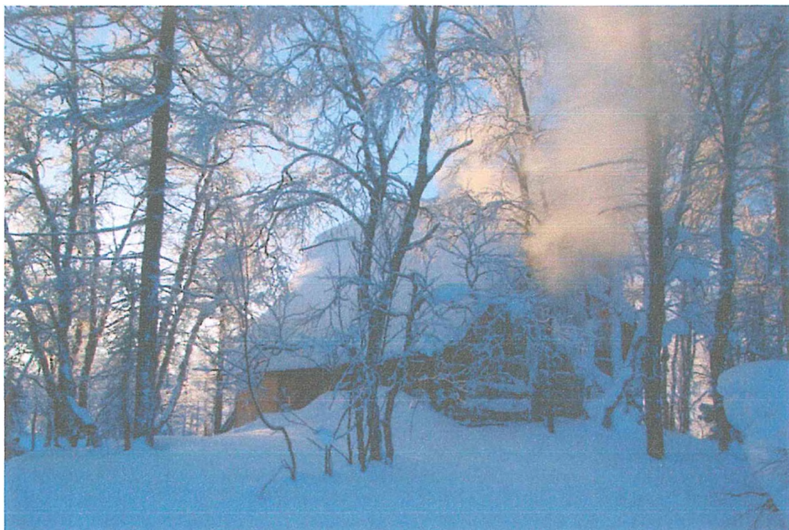
Фото 3. Туристский приют «Озёрная».