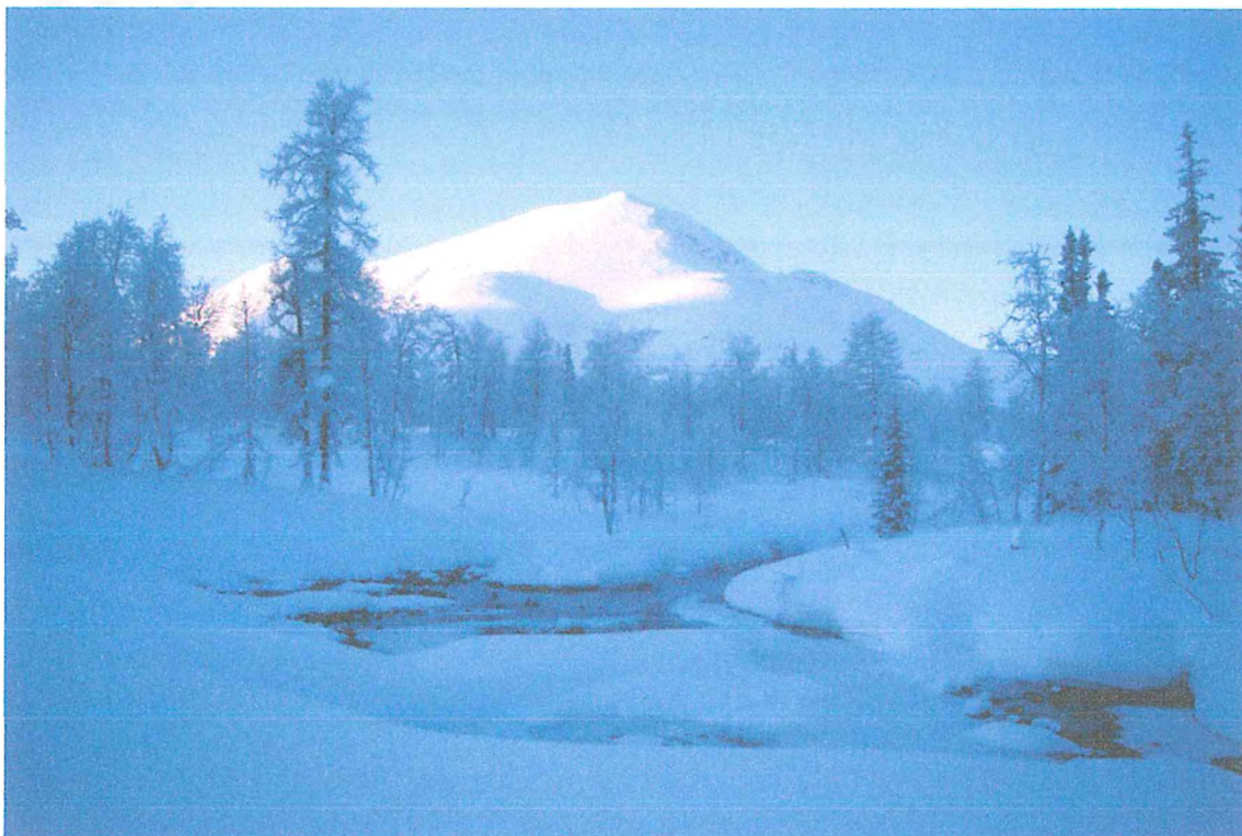
Фото 1. Гора Шудаиз.