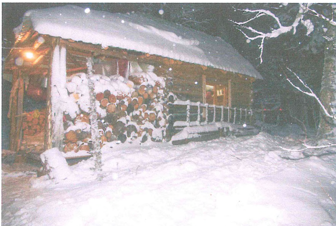
Фото 2. Туристский приют «Междуречье».