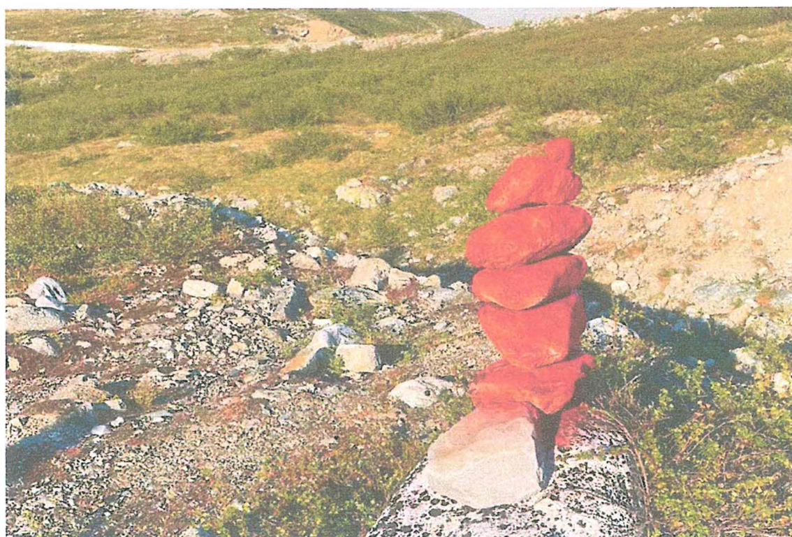
Фото 2. Туры на маршруте.