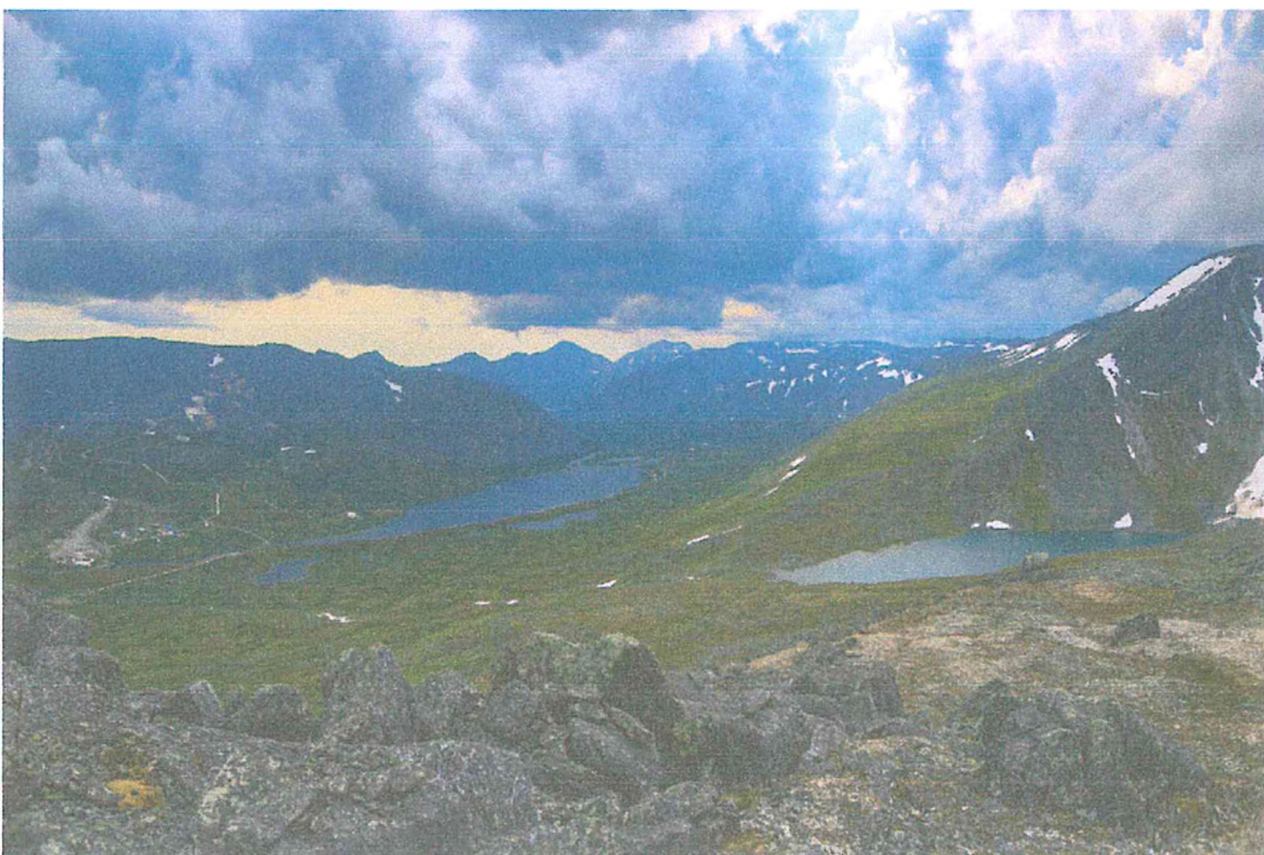
Фото 4. Вид на озера Грубепендиты и Большое Балбанты.