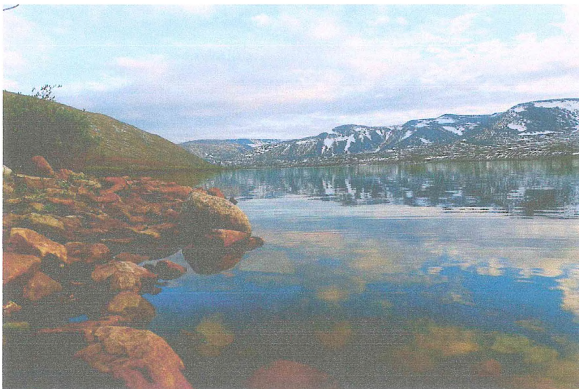
Фото 5. Река Балбанью и хребет Малдынырд.