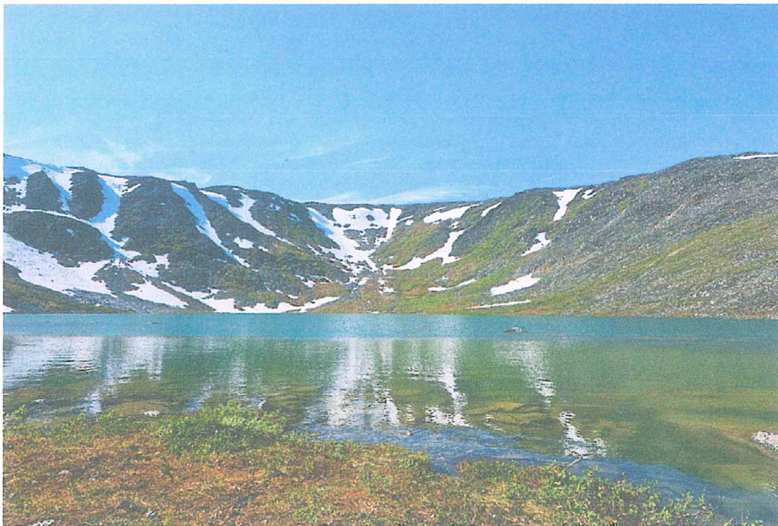
Фото 3. Озеро Грубепендиты.