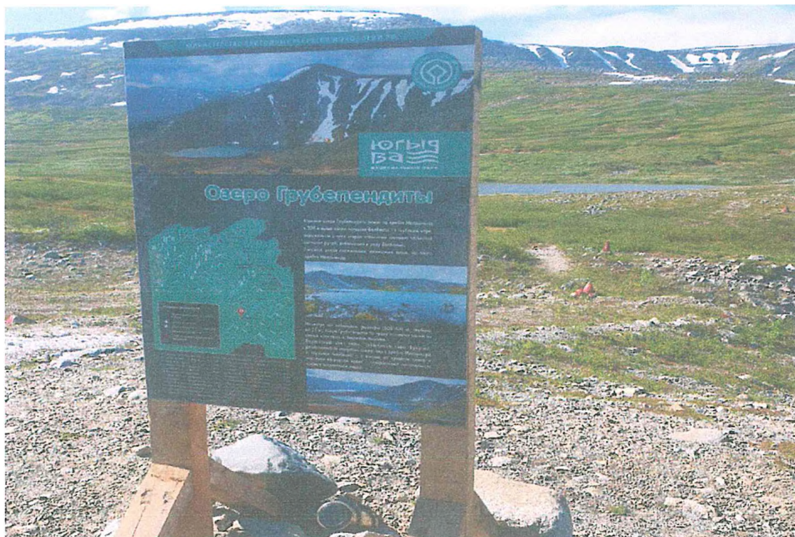
Фото 1. Входной аншлаг в начале маршрута.