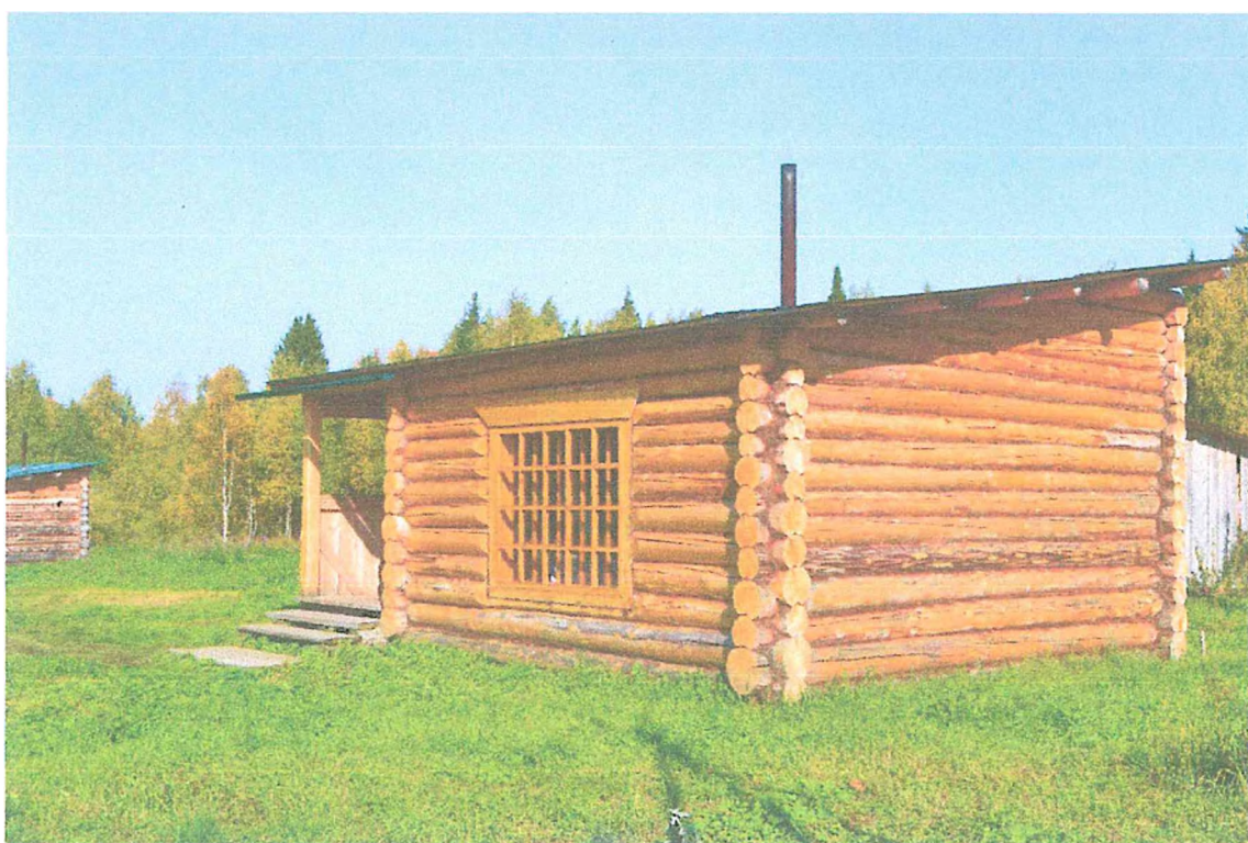
Фото 6. Туристский приют «Петный».