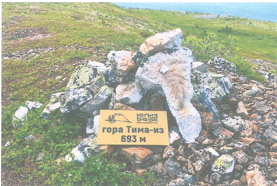
Фото 5. Информационная табличка Тимаиз.