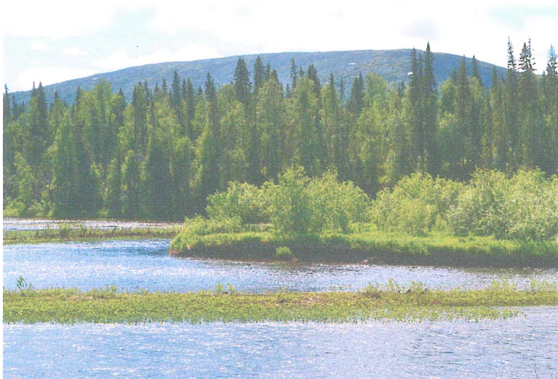
Фото 1. Хребет Тимаиз (вид с реки).