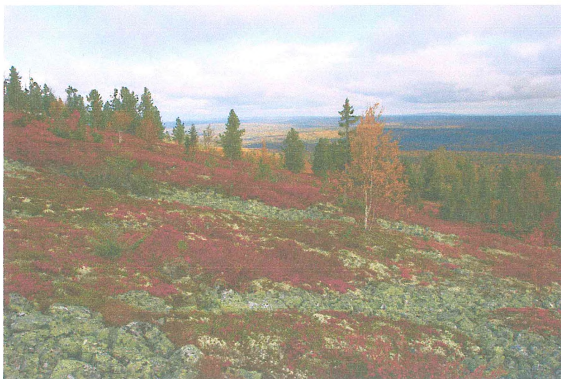
Фото 2. Склон хребта Тимаиз.