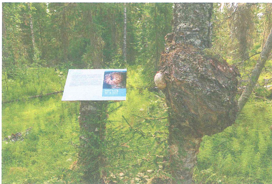
Фото 4. Информационная табличка.