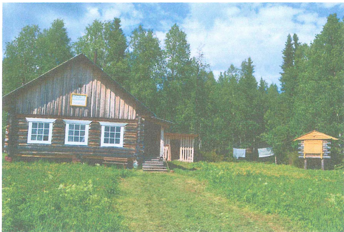
Фото 1. Туристский приют Большой Емель.