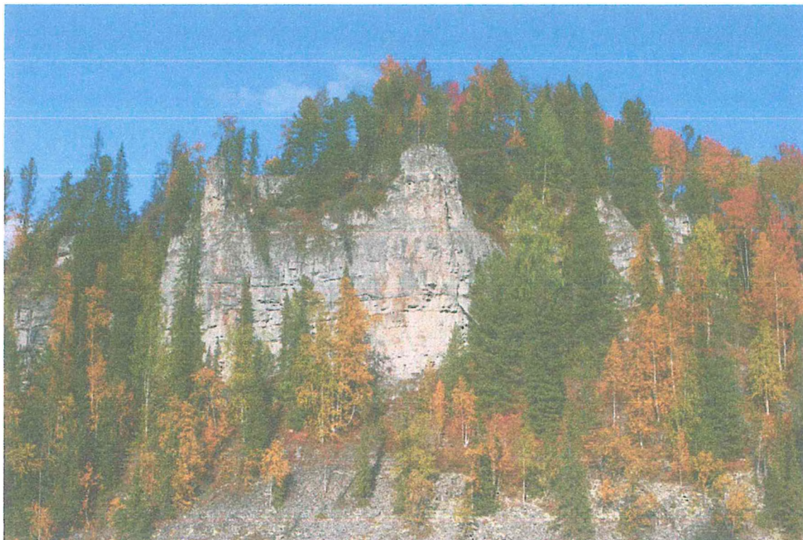
Фото 9. Скала Замок.