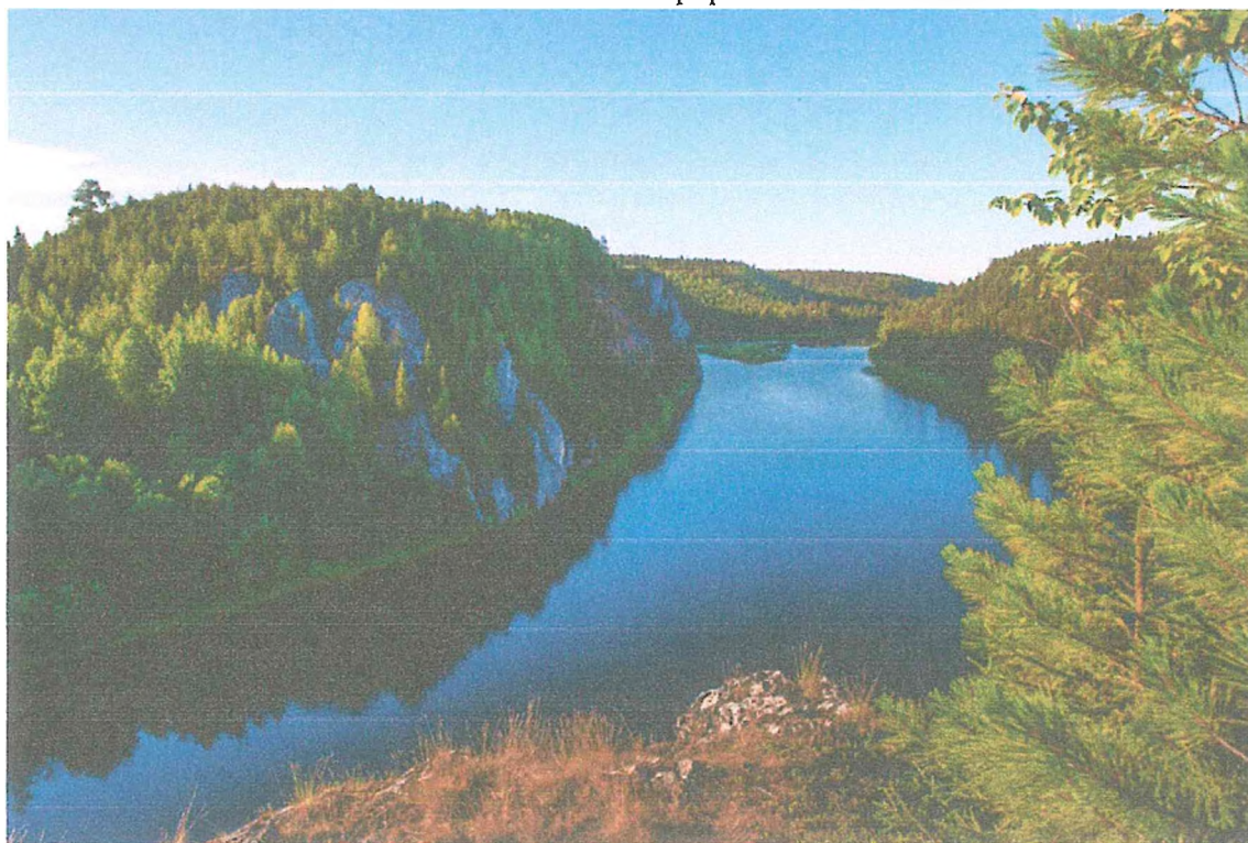
Фото 10. Нижние ворота реки Подчерем.