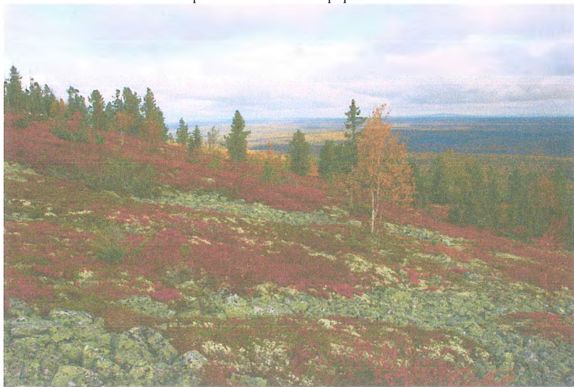
Фото 6. На вершине хребта Тимаиз.