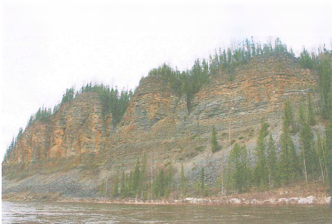
Фото 8. Скала Кирпич-Кырта.