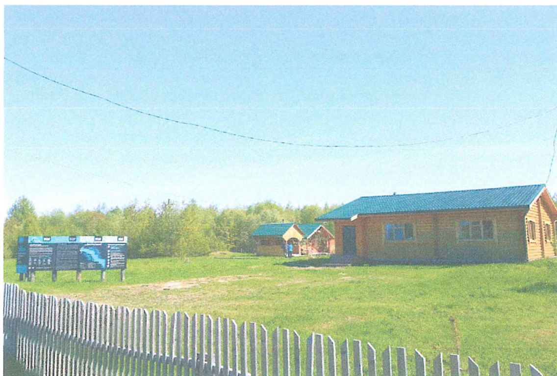
Фото 4. Гостевой дом в п. Подчерье.