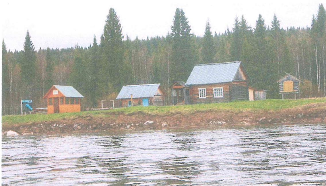
Фото 3. Туристский приют Орловка.